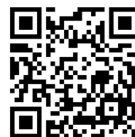
研修会 申込フォーム

10. 留意事項 ・録音、録画、撮影は禁止いたします。 ・主催者による写真撮影を行います。 研修報告等で写真を使用する場合がございます。 予めご了承ください。